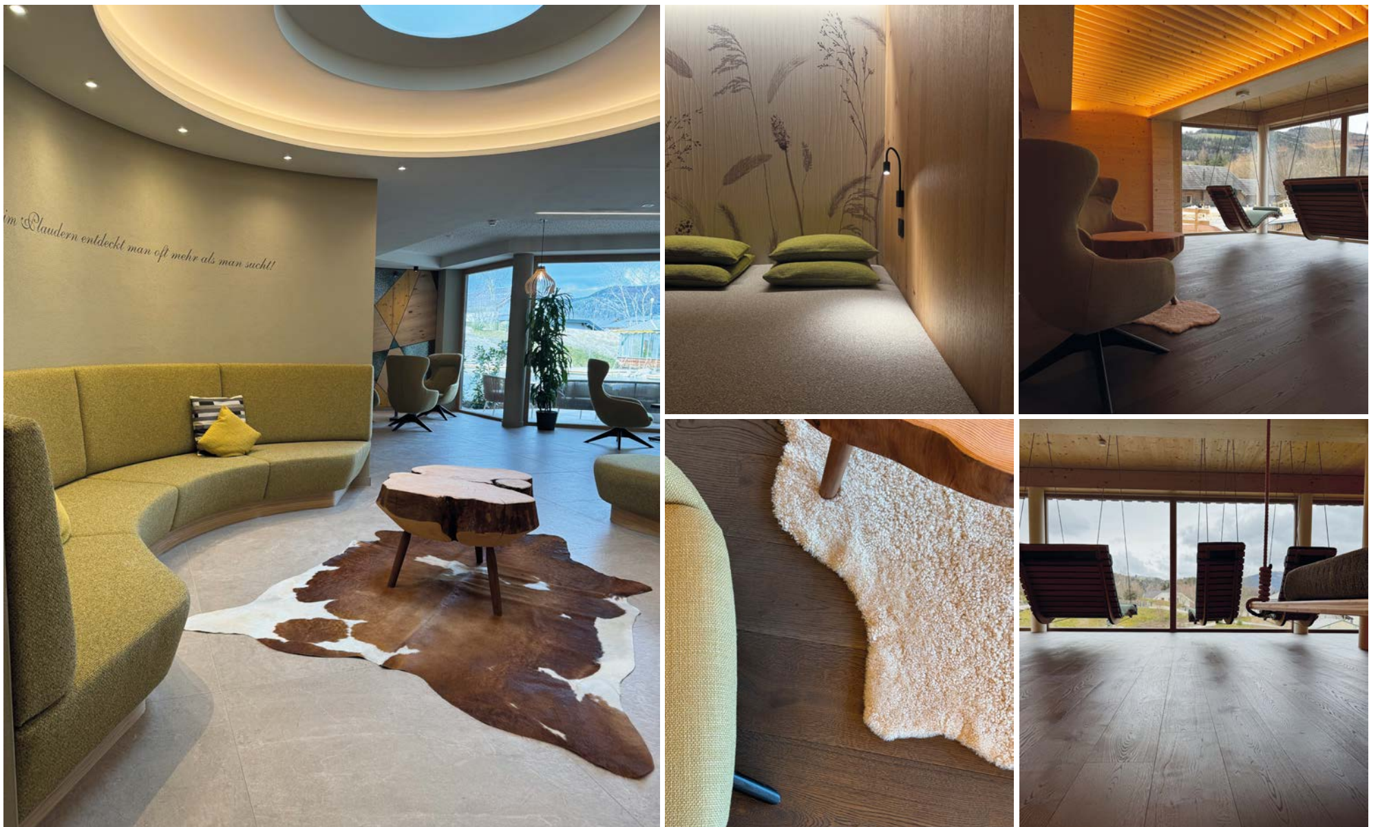
Naturhotel Molzbachhof in Kirchberg am Wechsel